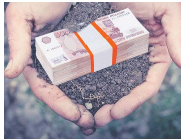
Коллаж Татьяны НОВИКОВОЙ

Житель Московской области обманул троих предпринимателей на 10 млн рублей. Бизнесмены поверили обещанию посодействовать в приобретении земельных участков в Домодедовском районе.