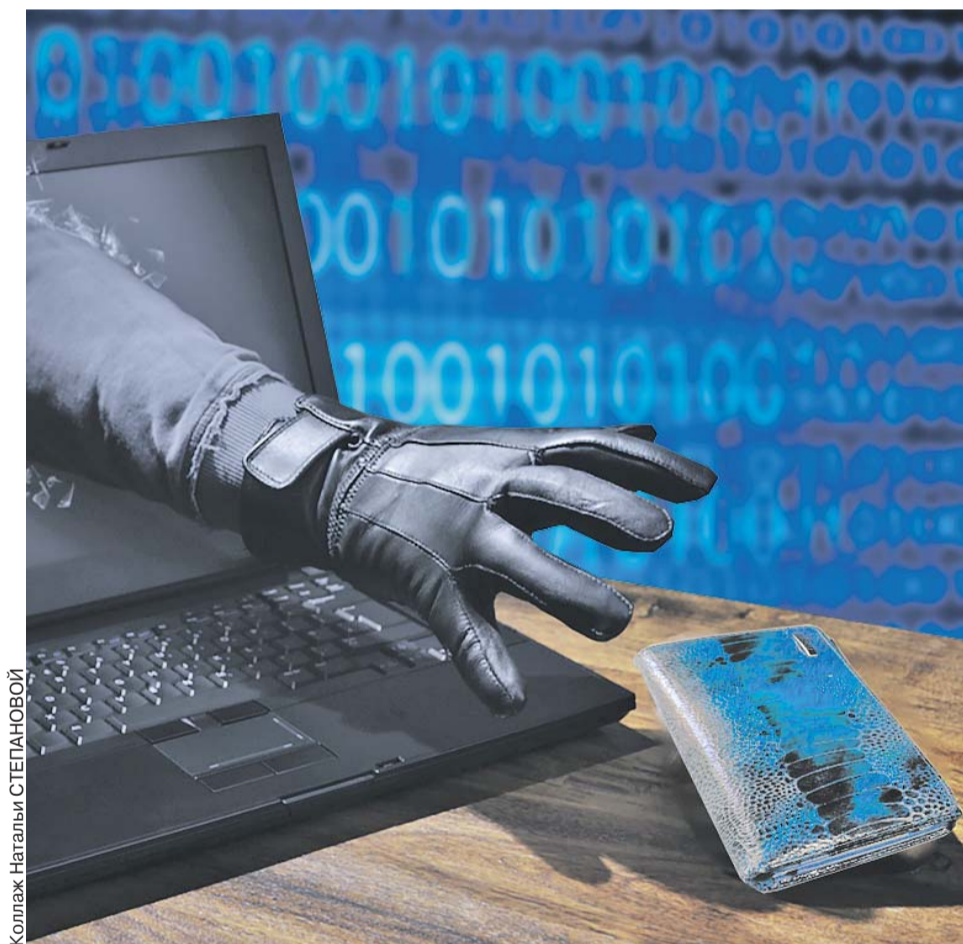
Коллаж Натальи СТЕПАНОВОЙ

- Больше их не становится. А происходит это из-за колоссального увеличения числа компьютерных программ. В первую очередь сейчас это касается данных на мобильных устройствах. Как правило, именно они становятся жертвами троянских программ с целью хищения денег с банковских счетов граждан. Применительно к персональным компьютерам - это всё чаще программы-вымогатели. Здесь основным мотивом также является деньги. И в целом вся колоссальная индустрия - ки-